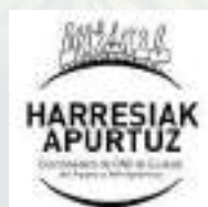
Coordinadora de ONG de Euskadi de apoyo a personas inmigrantes